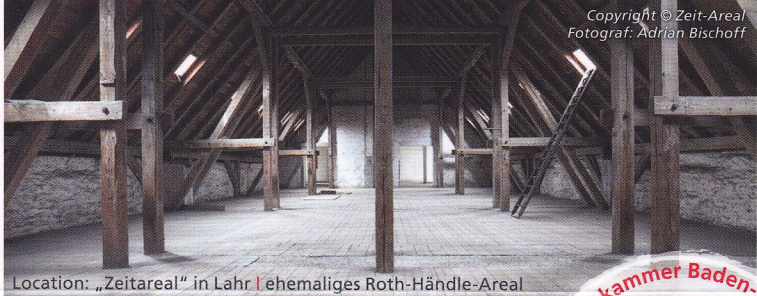
Location: „Zeitareal“ in Lahr | ehemaliges Roth-Händle-Areal